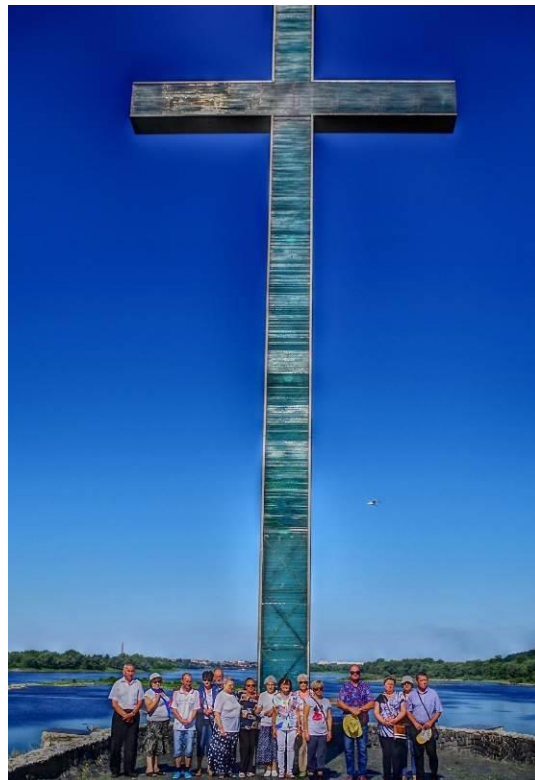
Włocławek - Krzyż upamiętniający męczeńską śmierć ks. Popiełuszki.