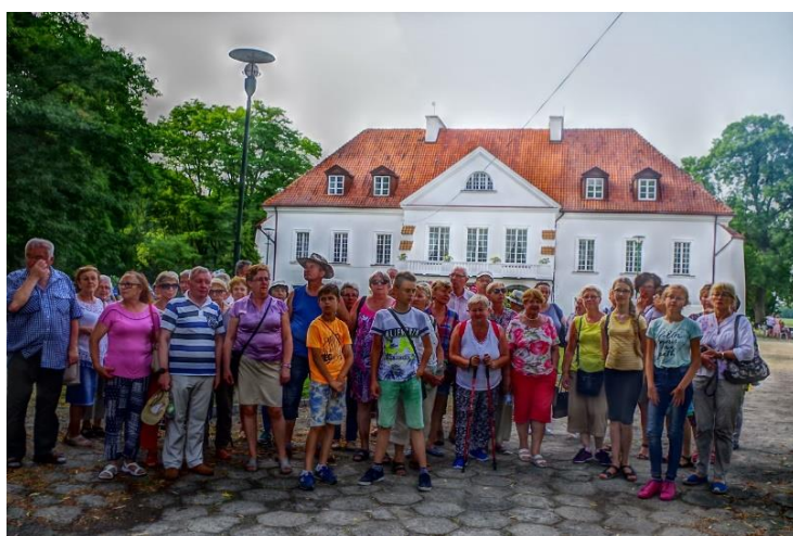
Dwór w Kalinowej.

Straszny dwór z tytułowej opery Stanisława Moniuszki istnieje naprawdę. Dwór w Kalinowej uważany jest za pierwowzór „straszego dworu” z opery Stanisława Moniuszki. Ponadto we wsi znajduje się gotycki kościół św. Marii Magdaleny, z 1465-1468 r, gdzie kompozytor Stanisław Moniuszko grał na organach. Stanisław Moniuszko był wzorem patrioty i - jak pisał w 1921 roku