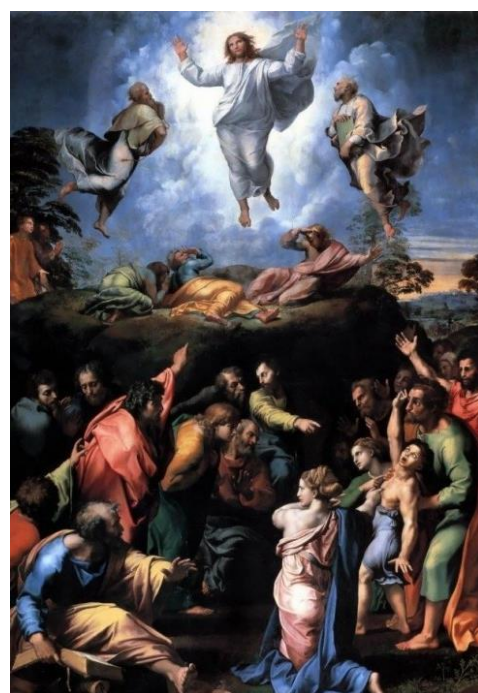
„Przemienienie Pańskie” /Rafaela Santi/