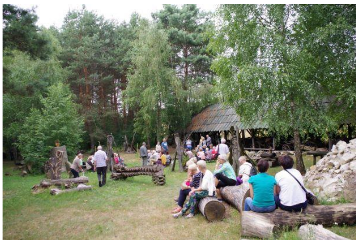
Zagroda Wyobraźni – Nad Czarną i Pilicą

rzy z rzeczy znalezionych, wiejskich dawnych sprzętów, które połączone z przedmiotami z całkiem innych, ale