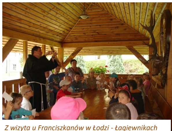
Z wizytą u Franciszkanów w Łodzi - Łagiewnikach