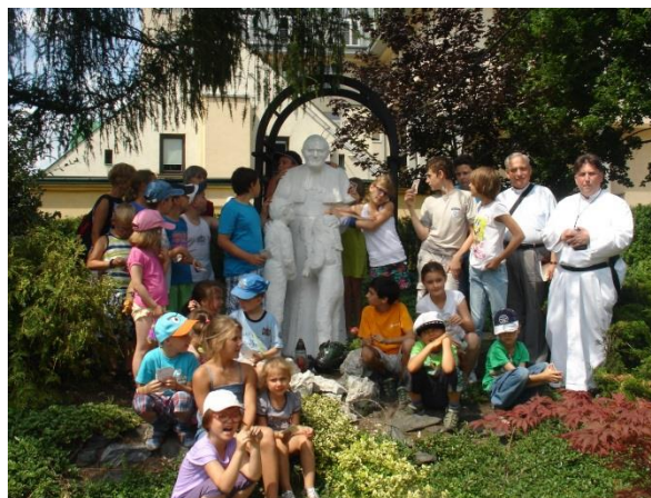
Z wizytą u Bonifratrów w Łodzi

Dzieci miały możliwość zapoznania się ze specyfiką pracy Wojskowej Straży Pożarnej w Łasku oraz oglądały helikoptery w Wojskowych Zakładach Lotniczych w Łodzi. W trakcie wypoczynku był czas na rekreację fizyczną m.in. zabawy sportowe w Kolegium Nauczycielskim w Zgierzu, wizyty w pływalni „Wodny