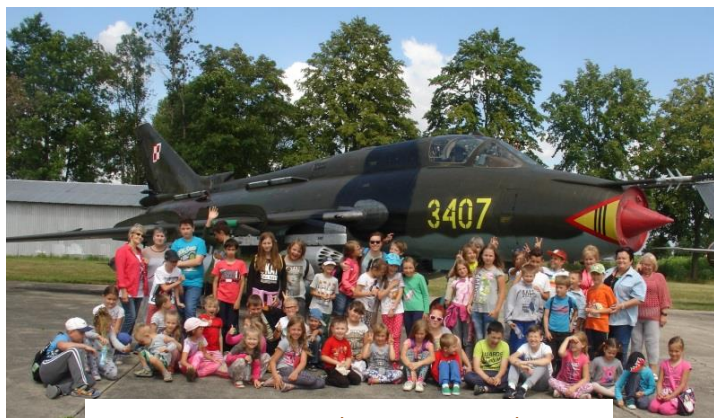
32. Baza Lotnictwa Taktycznego w Łasku

Koloniści udali się między innymi do Leśnictwa Miejskiego i Łódzkiego Klubu Jeździeckiego w Łagiewnikach, zapoznali się z pracą dziennikarza w redakcji „Dziennika Łódzkiego”, a także podziwiali niebo nad Łodzią w Planetarium i Obserwatorium Astronomicznym w Łodzi. Mali podróżnicy wybrali się również do Białej Fabryki - Muzeum Włókiennictwa w Łodzi, Muzeum Ziemi Łaskiej, Schroniska Młodzieżowego w Łodzi, a także oglądali samoloty wojskowe w 32. Bazie Lotnictwa Taktycznego w Łasku.