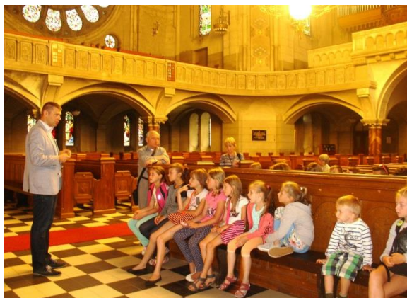
Kościół Ewangelicko-Augsburski św. Mateusza w Łodzi.