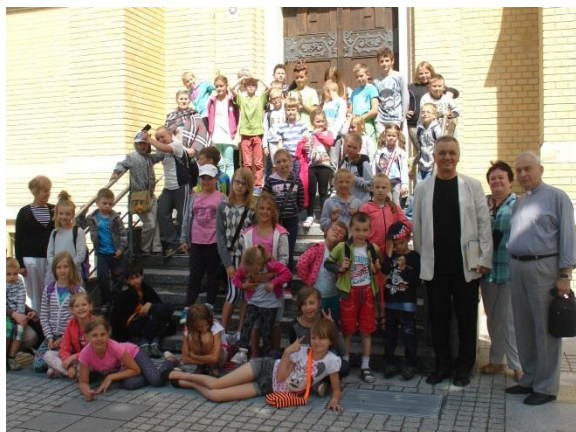
Bazylika Archikatedralna w Łodzi

W dniach od 20 do 31 lipca 2015r. ponad 60 dzieci z miasta Zgierza uczestniczyło w półkoloniach, zorganizowanych przez Parafialny Oddział Akcji Katolickiej w Zgierzu wraz z Parafią Matki Boskiej Dobrej