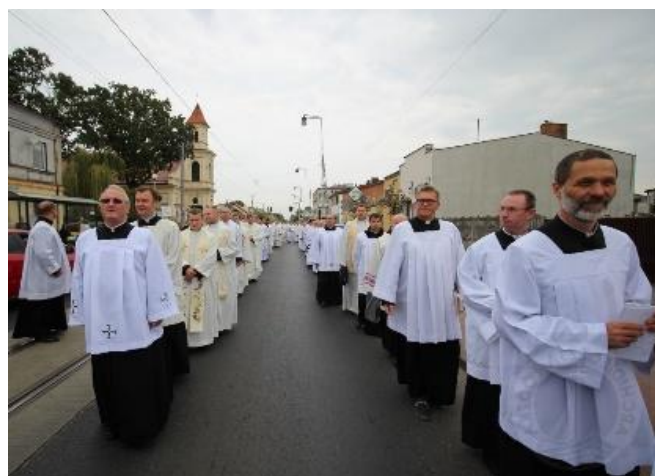
Procesja ulicami miasta w Konstancynie Łódzkim.

Kończąc liturgię, po błogosławieństwie, Arcybiskup Archidiecezji Łódzkiej dokonał poświęcenia pomnika, znajdującego się przed świątynią, który upamiętnia kapłanów męczenników z diecezji łódzkiej, częstochowskiej, wrocławskiej i archidiecezji poznańskiej. Następnie,