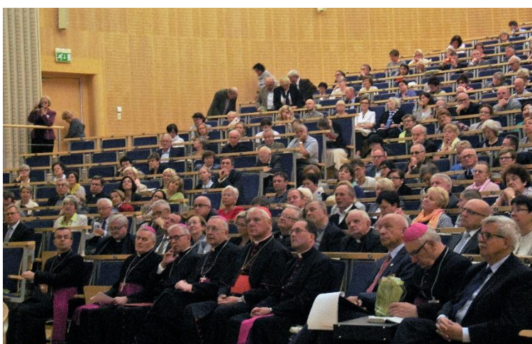
Poznańskie Forum Duszpasterski.

„Człowiek, który spotyka Boga, nie może nie mówić innym tego świadectwa. Jest ono imperatywem w samej istocie bycia chrześcijaninem” – podkreślił w homilii kard. Gerhard L. Müller. Zachęcał wszystkich do stałej formacji, która będzie drogowskazem do kro-