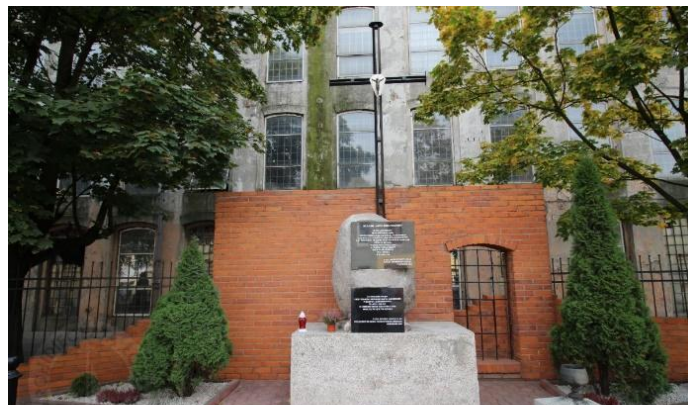
Pomnik przed budynkiem obozowym.

koniec, pragniemy modlić się za naszą Ojczyznę, aby budowała swoją przyszłość na pamięci o ludziach, którzy dla niej cierpieli, i dla niej oddali swoje życie” – podkreślił pasterz Kościoła Łódzkiego.