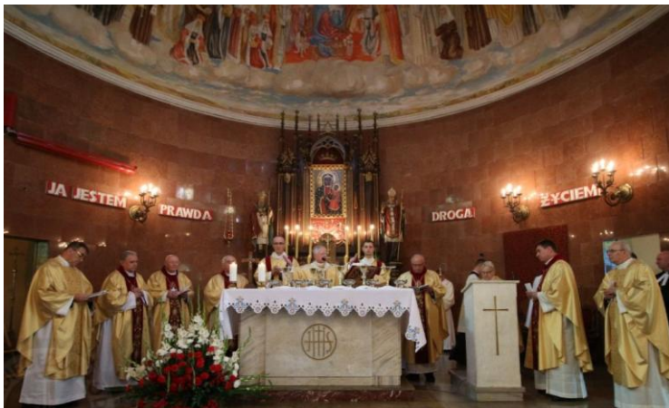
Msza Św. w kościele pw. Narodzenia NMP w Konstancynie Łódzkim, upamiętniająca ofiarę polskich kapłanów męczenników.

„Dziękujemy dziś Bogu za to, że dzisiaj, tutaj w Konstancynie Łódzkim, możemy przeżywać cząstkę martyrologium duchowieństwa polskiego, która łączy się z tym niezwykłym świadectwem krzyża, stojącego na ołtarzu. Świadka tamtych chwil i tamtego czasu, kiedy kapłani uwięzieni i wywiezieni do obozu koncentracyjnego w Dachau, modlili się przed nim, prosząc o łaskę wolno-