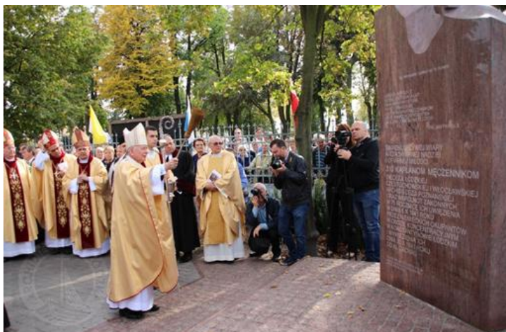
Abp. M. Jędraszewski – poświęcenie pomnika upamiętniającego księży męczenników więzionych przez Niemców w Konstancynie Łódzkim i zamordowanych w Dachau.

W liturgii, która była sprawowana pod przewodnictwem Metropolity Łódzkiego, wzięli udział księża arcybiskupi i biskupi z archidiecezji łódzkiej, częstochowskiej, poznańskiej i wrocławskiej oraz licznie zgromadzeni kapłani diecezjalni i zakonni, a także wierni