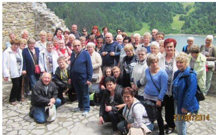
Grupa wyjazdowa, fot. Sylwester Sobiech

Szczawnica to dla nas wspomnienie wyjazdu wyciągiem krzeselkowym na Palenicę. Mieliśmy też okazję pospacerować po Parku Zdrojowym. W tym znanym, nie tylko w Polsce, uzdrowisku leczy się