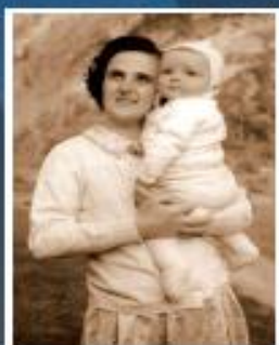
Św. Joanna Beretta-Molla