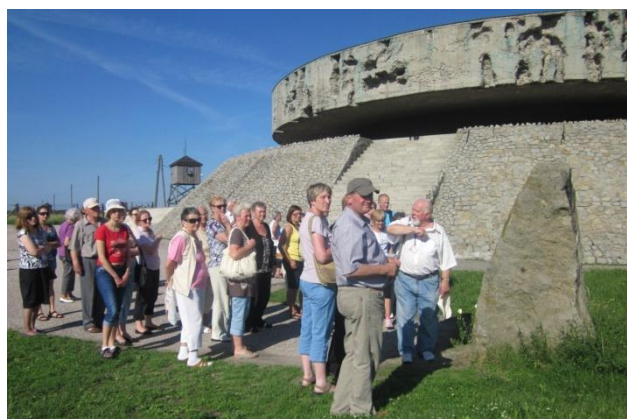
Nasi parafianie na Majdanku